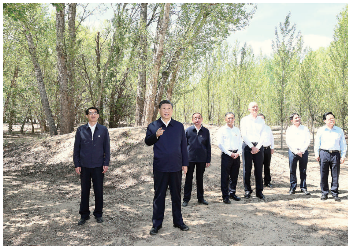
6月5日至6日,中共中央总书记、国家主席、中央军委主席习近平在内蒙古巴彦淖尔考察,并主持召开加强荒漠化综合防治和推进“三北”等重点生态工程建设座谈会。这是6日上午,习近平在临河区国营新华林场考察。