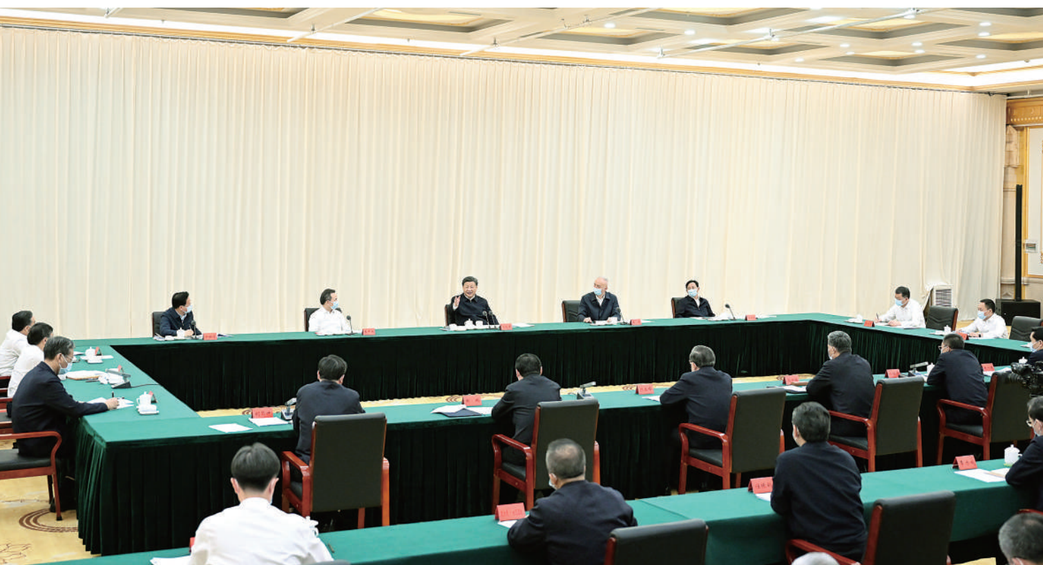
6月6日,中共中央总书记、国家主席、中央军委主席习近平在内蒙古巴彦淖尔主持召开加强荒漠化综合防治和推进“三北”等重点生态工程建设座谈会并发表重要讲话。