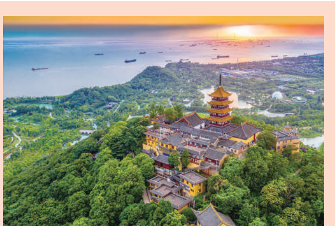
鸟瞰南通五山地区生态美景

组织四级政协委员、党派团体和群众代表，围绕长江大保护、沿江沿海生态景观带建设、五山生态环境修复等社会关注的热点集中视察，让他们及时了解全市重点工作进展和成效，让社会各界理解支持生态文明建设。285公里的生态景观带，成为贯通南通沿江沿海的“江海之链”。站在宽阔的滨江廊道上，市民们一张张笑脸洋溢着满足感和幸福感。2022年，南通生态文明建设公众总体满意度91.4%。(黄欢)