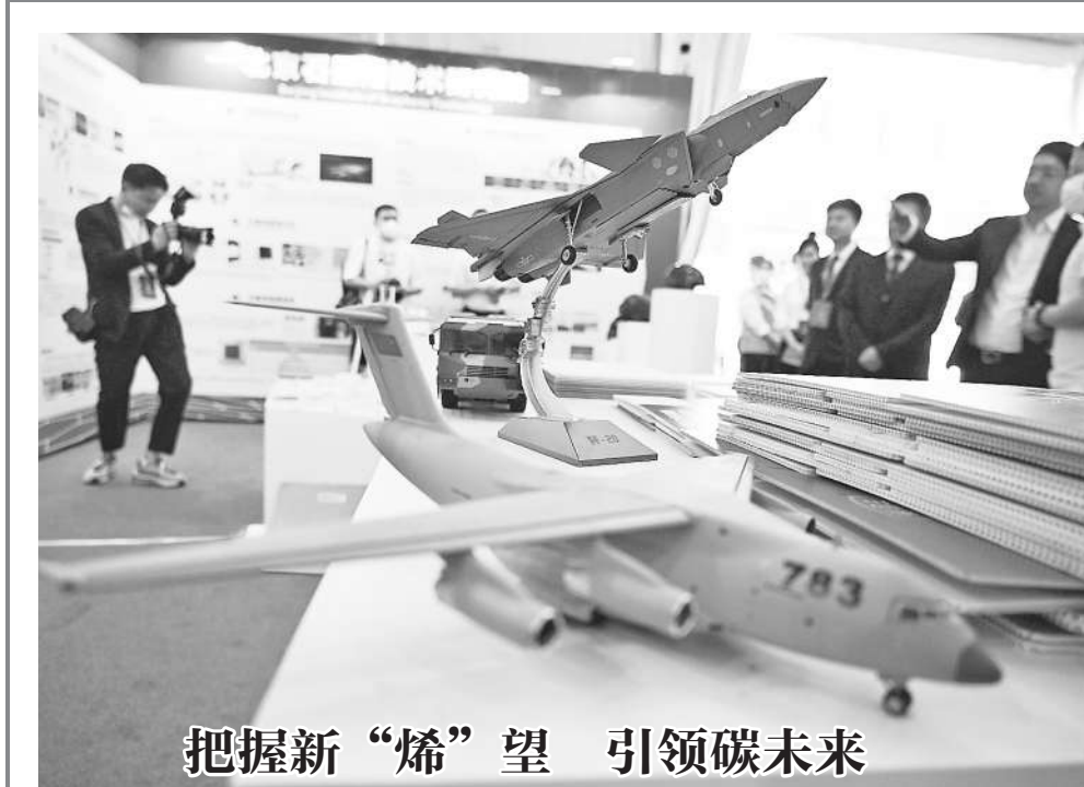
把握新“烯”望 引领碳未来

“我国拥有丰富的野生葡萄资源,葡萄属70多个品种中我国就有近40种。利用发现的野生葡萄丰富的基因资源,将有利于落实现代育种技术的应用和培育优良葡萄新品种。”周永锋表示。