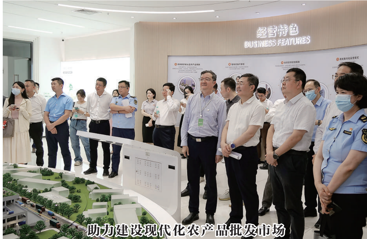
助力建设现代化农产品批发市场

“太行山上·非遗文创展”的成功举办,是市政协推动“书香政协”建设的一个缩影。市政协还将逐步打造出一批抓得实、叫得响的“书香品牌”,引导委员们深入学习各领域知识,锤炼建言资政的履职能力,为建设现代化太行山水名城凝心聚力、夯基赋能。