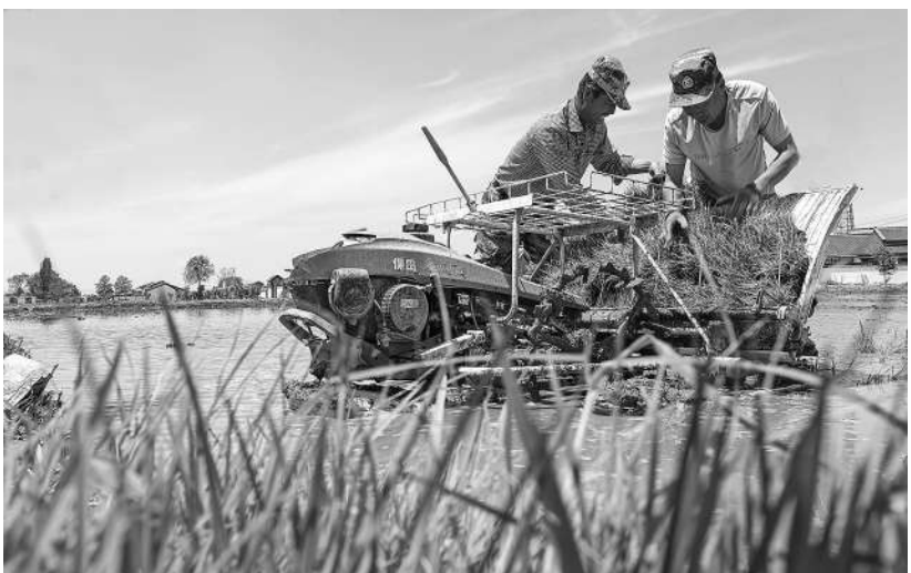
连日来，甘肃省张掖市甘州区乌江镇、靖安乡的稻田里，插秧机同农户来回穿梭插秧，一派繁忙景象。据悉，当地水稻种植已有1300年的历史，所产的“黑芒稻”最受群众欢迎。

随着学镇会客厅斩获国际奖项，这里正逐渐成为更多人的“生活圈”和“打卡点”，这座广泛凝聚各方智慧的建筑正在大放异彩。接下来，吴江区政协还将继续发挥协商议事的平台作用，通过“有事好商量”为干事创业打造稳固“地基”，为本地发展汇聚更多“好声音”。（董斌 王满 陈依琳）