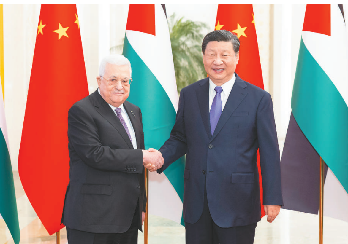
六月十四日下午,国家主席习近平在北京人民大会堂同来华进行国事访问的巴勒斯坦总统阿巴斯举行会谈。这是会谈前,习近平在人民大会堂北大厅为阿巴斯举行欢迎仪式。