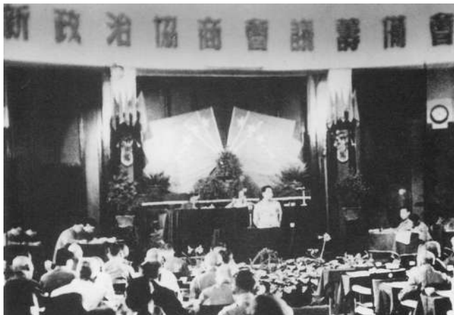
▲周恩来主持会议时,背景中出现了军旗,这是中国人民解放军军旗首次出现在公众场合。

1949年6月15日,新政协筹备会开幕。回首74年前的新政协筹备会,不仅让这一年的六月光鲜亮