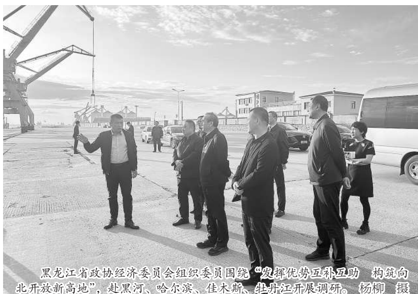
黑龙江政协经济委员会组织委员围绕“发挥优势互补互助 构建向北开放新高地”赴黑河、哈尔滨、佳木斯、牡丹江开展调研。

“企业家委员要勇闯创新创造关、转型升级关、绿色低碳关、数字智能关,守牢安全发展关,做好生产经营,坚持创新引领,加大投入力度,负起社会责任,在拼经济促发展中带好头、当先锋。”市政协主席李爱杰表示,对委员所在企业提出的意见建议,政协要逐条梳理研究,及时提报市委、送相关部门。