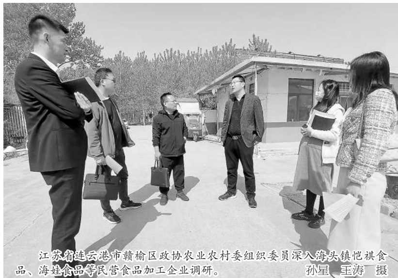
江苏宿迁云港市政协农业农村委组织委员深入海头镇悦祺食品、海娃食品等民营食品加工企业调研。

区农业农村委副主任黄凤回说,下一步将抓住共建国家农高区这一契机,持续推动渝北区“一区四带、三业七品”发展,提档升级南北大道沿线农业项目,努力推动渝北现代高效特色农业产业示范带建设取得新突破。