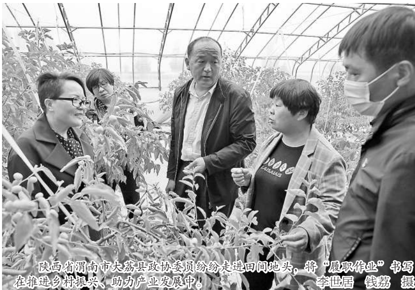
陕西省渭南市大荔县政协委员纷纷走进田间地头,将“履职作业”书写在推进乡村振兴、助力产业发展中。李世居 钱荔 摄