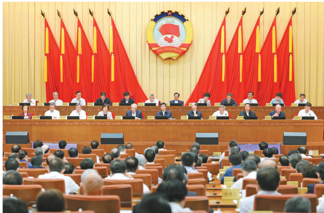
六月二十六日上午,政协十四届全国委员会常务委员会第二次会议在北京开幕,围绕“构建新发展格局,推进中国式现代化”协商议政。中共中央政治局常委、全国政协主席王沪宁出席开幕会。

中共中央政治局委员、全国政协副主席石泰峰主持开幕会。他表示,中共二十大擘画了全面建设社会主义现代化国家、以中国式现代化全面推进中华民族伟大复兴的宏伟蓝图,对加快构建新发展格局、着力推动高质量发展作出重大部