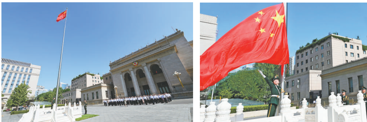
6月30日，全国政协机关在全国政协礼堂(中共八大会址)前举行升国旗仪式，庆祝中国共产党成立102周年。

本报讯(记者 吕巍)为庆祝中国共产党成立102周年，深入开展学习贯彻习近平新时代中国特色社会主义思想主题教育，强化党的创新理论武装，激励广大党员干部在全面建设社会主义现代化国家、全面推进中华