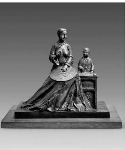
▲雕塑《不忘初心》 许鸿飞 作