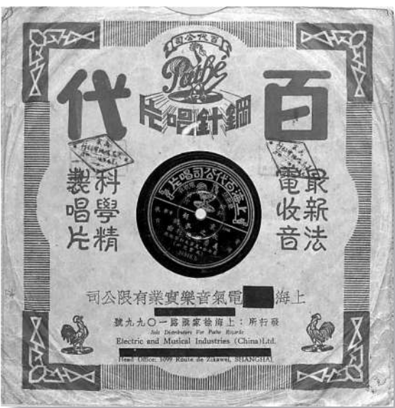
▲1935年上海百代公司发行的《义勇军进行曲》首版唱片

同年6月，新政治协商会议筹备会在北平召开，筹备会议第六小组负责拟定新中国的国旗、国徽、国歌方案。9月25日，新政协召开国旗、国徽、国歌、纪年、国都协商座谈会。会上，马叙伦等主张暂用《义勇军进行曲》为代国歌。徐悲鸿、郭沫若等都表示赞成。因原歌词中有“中华民族到了最危险的时候”等历史性词句，郭沫若、田汉等建议将歌词修