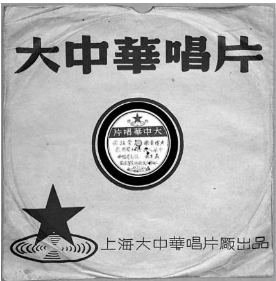
▲1949年上海大中华唱片厂发行的《中华人民共和国国歌唱片》

改一下。张奚若、梁思成认为应该保持歌词的完整性，黄炎培也赞成不修改歌词。经讨论，大家都赞同和支持不修改歌词。