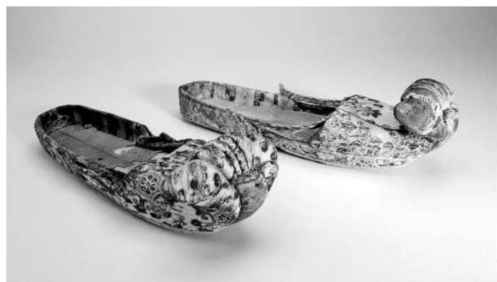
唐代，长27.1厘米，宽8.8厘米，高8.3厘米，1968年吐鲁番市阿斯塔那墓地出土，新疆维吾尔自治区博物馆藏。

新疆维吾尔自治区博物馆藏唐代变体宝相花纹锦云头锦鞋，出土于吐鲁番市阿斯塔那墓地，长29.7厘米，宽8.8厘米，高8.3厘米，此双锦鞋采用唐代最典型的变体宝相花纹锦组成鞋面，以黄色锦作地，其上织蓝色变体宝相花纹。