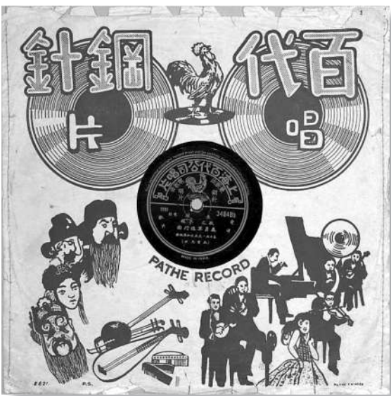
▲在印度灌制的《义勇军进行曲》第二版唱片