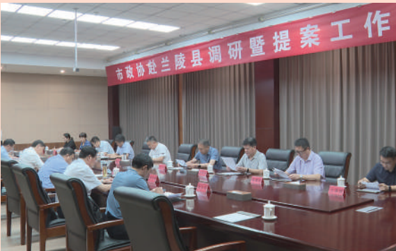
临沂市政协到兰陵县调研提案工作