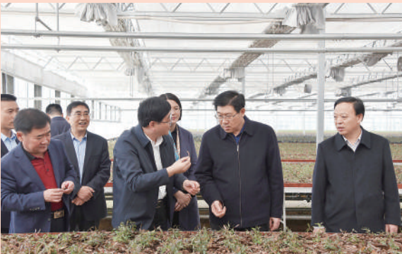
日照市政协主席杨留星(右二)带队调研东港区政协协商议事室

6月初,一场“知情明政”活动启动暨政协通报会拉开了潍坊市政协精心运筹的“一盘大棋”帷幕,“开展‘知情明政’系列活动,同心协力推动高质量发展”付诸实施。