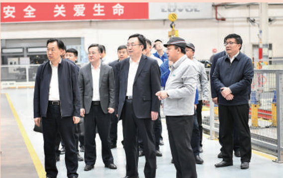
潍坊市政协主席李爱杰(前排右二)带队到企业调研