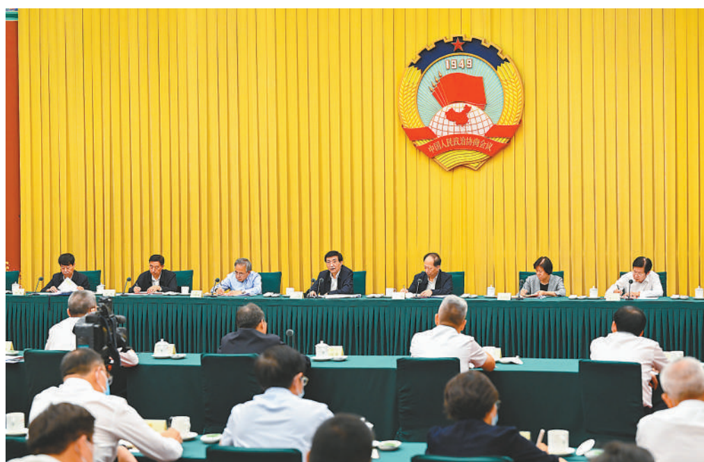
7月17日，全国政协在北京召开2023年上半年宏观经济形势分析座谈会，中共中央政治局常委、全国政协主席王沪宁出席并讲话。

本报讯（记者 吕巍）全国政协17日在京召开2023年上半年宏观经济形势分析座谈会，中共中央政治局常委、全国政协主席王沪宁出席并讲话。他表示，要从新时代我国经济发展历史性成就和当前我国经济运行持续回升向好态势中，从以习近平同志为核心的中共中央驾驭复杂局面、从容应对各种风险挑战的卓越政治智慧和高超领导艺