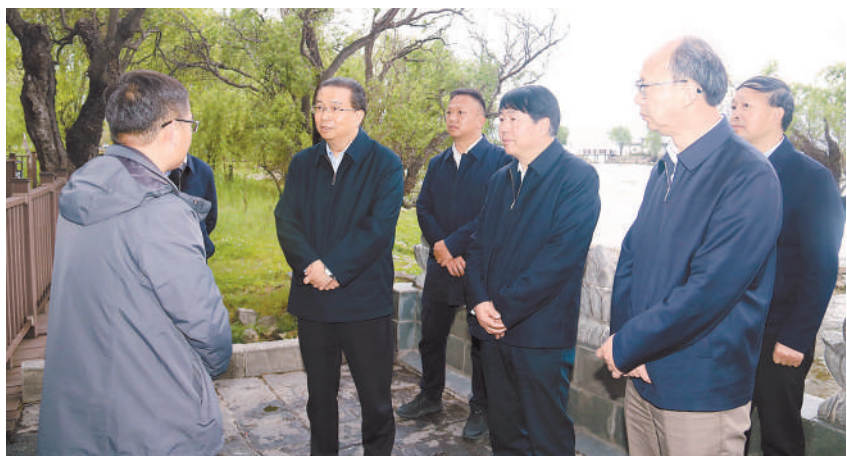
政协调研组在大理州调研洱海保护情况。三月二十八日，云南省