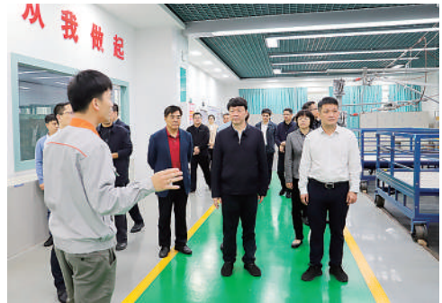
▲4月27日,柳州市政协围绕“强化创新驱动、深化产教融合”主题在柳州铁道职业技术学院调研。