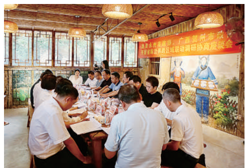
▲6月15日,贺州、永州两州市政协委员在富川瑶族自治县朝东镇委员联络站围绕“产业联动、共促发展”举行协商座谈会。

桥”的作用,围绕边界地区民生热点、难点、堵点问题开展协商交流,助推省际边界区域发展互促共进,是贺州市、县(区)两级政协孜孜探索的履职课题。