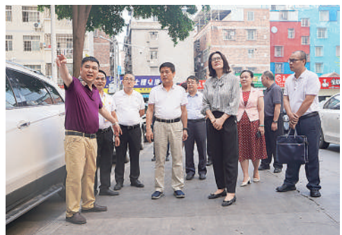
▲5月25日,南宁市政协深入街道社区开展“访民情、问民意、解民忧”专项行动。

“微提案、微协商、微建议”的主题全部来自基层一线、来自人民群众的“急难愁盼”,反映困难问题都是切口小、影响大的民生问题,也是政协委员关注民生、履职为民的