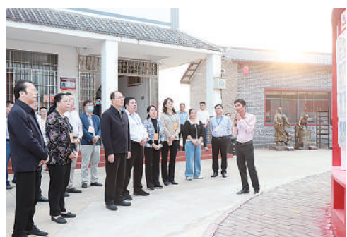
▲来宾市政协组织委员到象州县妙皇乡委员联络站视察,积极探索、持续推动政协协商与基层协商有效衔接。

市政协发动广大委员牵线搭桥、以商招商,推动服装、智能制造、冷链加工、生物医药等方面企业来柳考察、投资兴业。积极参与全市“企业服务年”活动,市政协领导联系32家全市重点企业和50家委员企业,推动涉及土地、融资、用工等方面70多个问题得到重视解决。围绕推进高等教育高质量发展、产教融合发展、提升民企研发创新能力等课题,深入调查研究,开展民主监督,助推柳州建设人才强市、强化创新驱动支撑,助力描绘工业重镇新画卷。