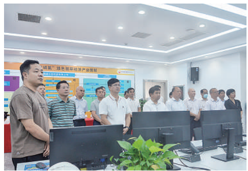
▲7月4日,崇左市政协组织政协委员到委员企业考察调研企业生产经营情况。

履行参政议政职能,凝聚各方力量,在担当作为中树立形象,在守正创新中提升效能,为实现南疆国门城市高质量发展、奋力打造国内国际双循环市场经营便利的崇左样板凝聚智慧和力量。