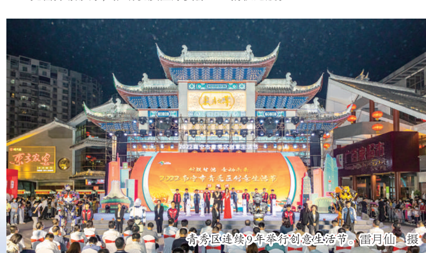
青秀区连续9年举行创意生活节。

新征程上，青秀区正以勇当先锋、时不我待的闯劲和拼劲，让“干部敢为、地方敢闯、企业敢干、群众敢首创”蔚然成风，在高质量发展的航道上扬帆远航。