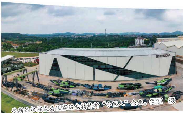
美斯达机械成为国家级专精特新“小巨人”企业。