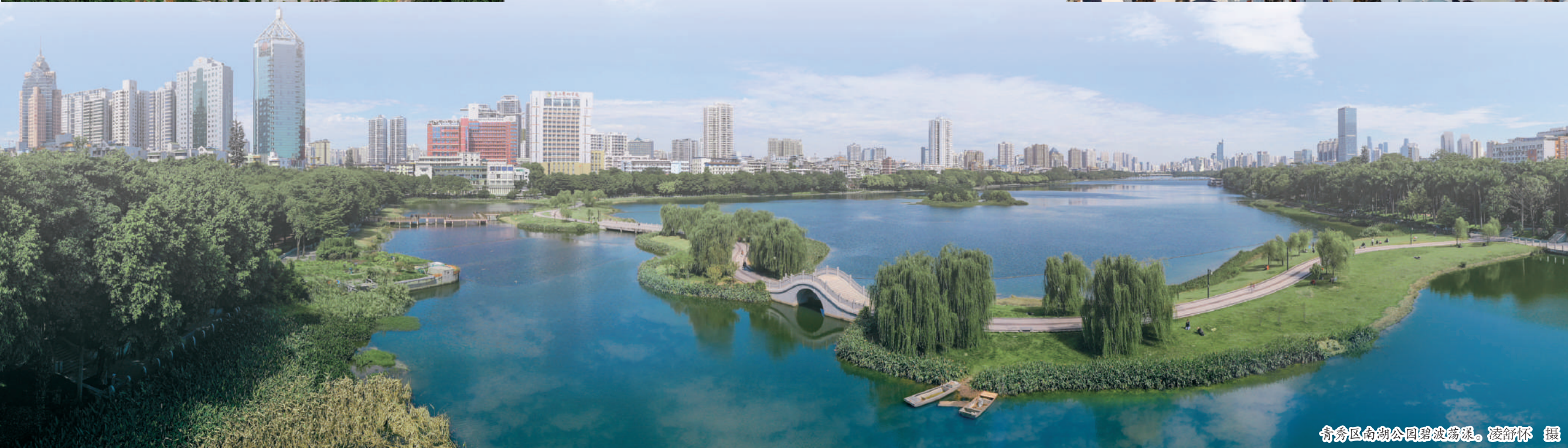
青秀区南湖公园碧波荡漾。