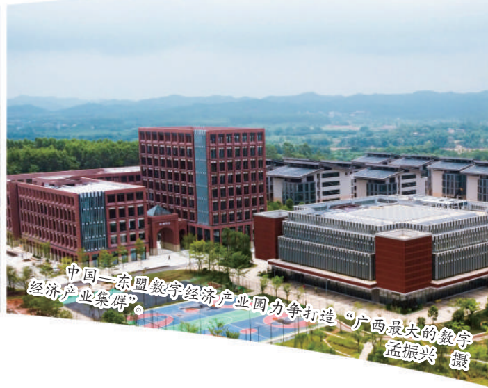
中国—东盟数字经济产业园力争打造“广西最大的数字经济产业集群”。