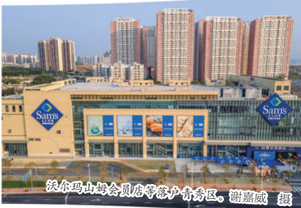
沃尔玛山姆会员店等落户青秀区。