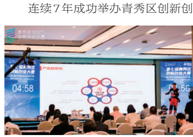
青秀区连续7年举行创新创业大赛。

2022年与深圳市水木深研创业研究院（由清华大学深圳国际研究生院发起成立的民办非企业机构）签署合作协议，共同建设运营青秀创新中心。今年4月1日—2日，青秀区还举办“清华专家南宁行”相关活动，邀请专家为青秀区创新发展“把脉献策”。截至今年6月，青秀创新中心共有人驻企业125家，园区入驻企业营收（产值）突破185亿元。 连续7年成功举办青秀区创新创业大赛，是广西唯一连续举办该赛事的县（区）。连续两年协办中国—南宁海（境）外人才创新创业大赛，为优质项目搭建对接平台，营造了良好的创新创业生态。连续9年以“创意”为主线举办大型文化活动，有效整合资源，把青秀区打造成为广西创意企业和人才集聚高地，培育发展新动能。