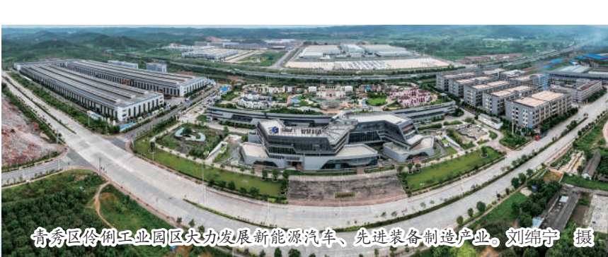
青秀区伶俐工业园区大力发展新能源汽车、先进装备制造产业。

现代服务业加速升级：中国—东盟数字经济产业园顺利开园，签订合作协议企业超70家，入园企业达46家，2022年青秀区规上科技服务业营业收入增长250%，稳居全市第一；辖区市场主体超15万个，拥有南宁40%以上的商场和市场、80%以上的高端酒店和餐饮娱乐业，长虹路万科广场、中山路万象汇、沃尔玛山姆会员店等知名商业综合体建成开业，辖区内街文化创意园获评广西旅游休闲街区，东盟文化和旅游片区入选第二批国家级夜间文化和旅游消费集聚区。青秀区正推动生产性服务业向专业化和价值链高端延伸、生活性服务业向高品质和多样化升级。