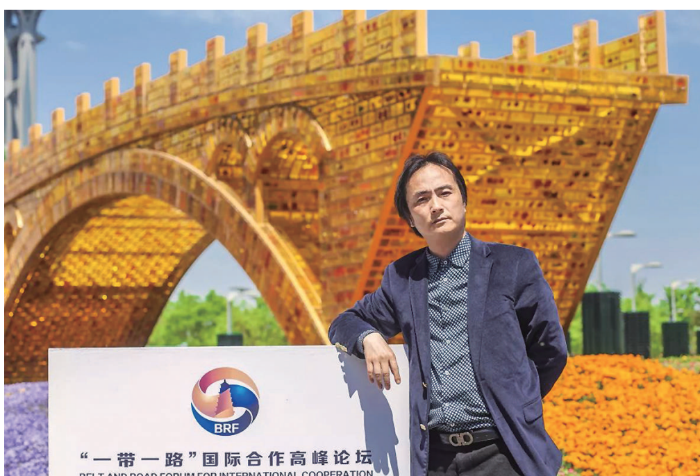
▲舒勇在自己的作品《丝路金桥》前

2023年是“一带一路”倡议提出10周年。全国政协委员，民进中央开明画院副院长、中国美术家协会理事舒勇以此为创作语境的《丝路金桥》，近年来受到广泛关注，成为一个重要的“文化符号”。舒勇是亚洲唯一获得佛罗伦萨国际艺术双年展终身成就奖的当代艺术家，当代中国精神是他近20多年来一直坚守创作的命题。他深谙中国传统文化，常常将中国传统文化与现代社会结合起来，使艺术作品焕发出时代生命力。本期文化强国系列邀请舒勇讲述他的艺术之旅。