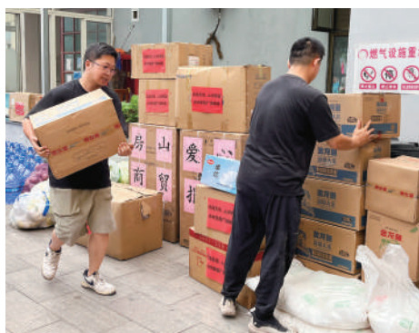
房山区政协把救灾物资送到北沟地区受灾异常严重的史家营乡