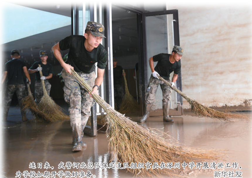
连日来,武警河北总队保定支队组织官兵在涿州中学开展清障工作,为学校如期开学做好准备。

信、清淤消杀……洪水过后,无数人日夜兼程,奔波在过渡安置和筹集、运送物资的道路上。