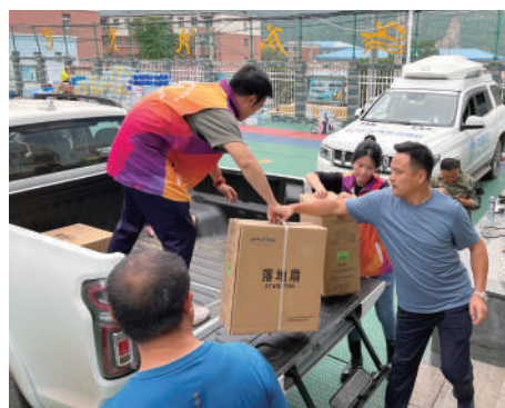
门头沟区政协发动委员积极向受灾群众捐助生活物资