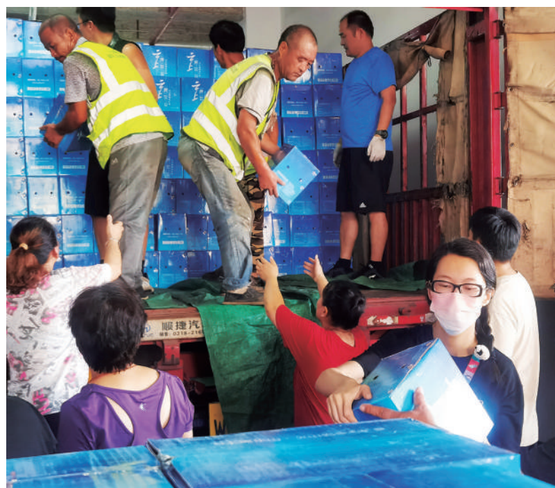
丰台区政协组织民盟界别委员和爱心人士向灾区捐赠物资