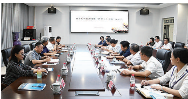
豫东振兴带动创建“世界美食之都”座谈会