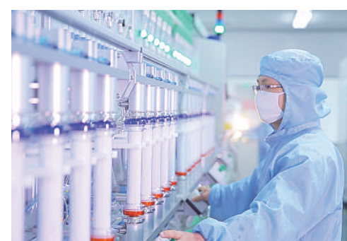
透析器生产工艺——湿法测漏