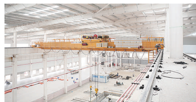
卫华集团自主研发并制定标准的新中式起重机