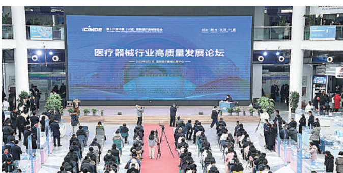
第十六届中国（长垣）国际医疗器械博览会暨医疗器械行业高质量发展论坛举行