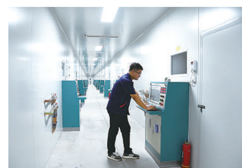
河南领创新材料科技有限公司高温高压生产车间内，工作人员正在查看六面顶压机运行情况。