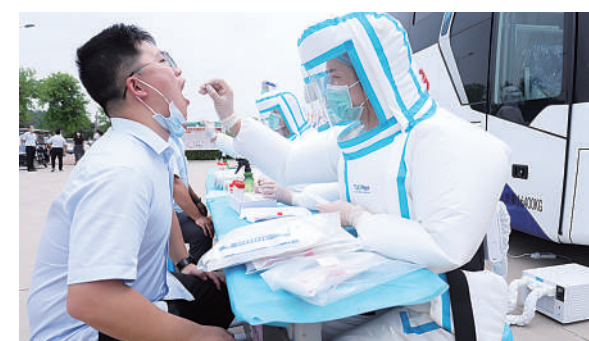
驼人集团承接河南省科技厅新型冠状病毒防疫应急科研攻关项目