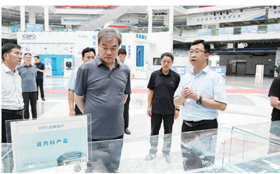
新乡市政协组织委员在长垣市调研项目建设

展经费投入强度已达3.36%，成功培育国家高新技术企业120家，国家技术创新示范企业2家，国家级专精特新“小巨人”企业14家，省级以上专精特新企业56家、创新型企业达到449家，高新技术产业增加值占规模以上工业增加值的比重达93.5%；与92家高校科研院所、10位院士、13位中原学者深度合作，建成运行中原学者工作站等省级以上创新平台133个，成功入选国家创新型县（市）建设名单。