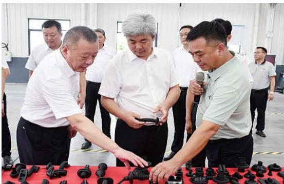
长垣市委主要领导到蒲北富景达橡塑有限公司调研