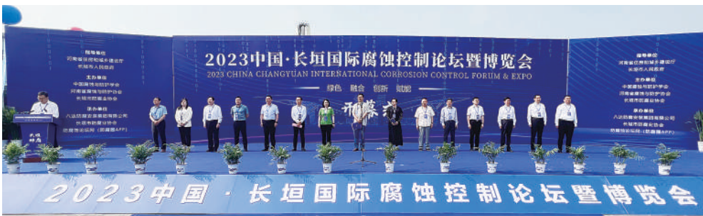
2023年中国·长垣国际防腐控制论坛暨博览会在长垣举办