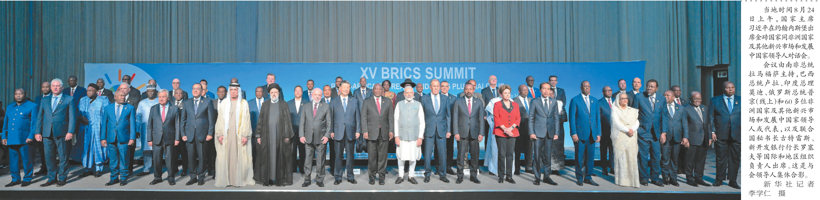
当地时间8月24日上午,国家主席习近平在约翰内斯堡出席金砖国家同非洲国家及其他新兴市场和发展中国家领导人对话会。