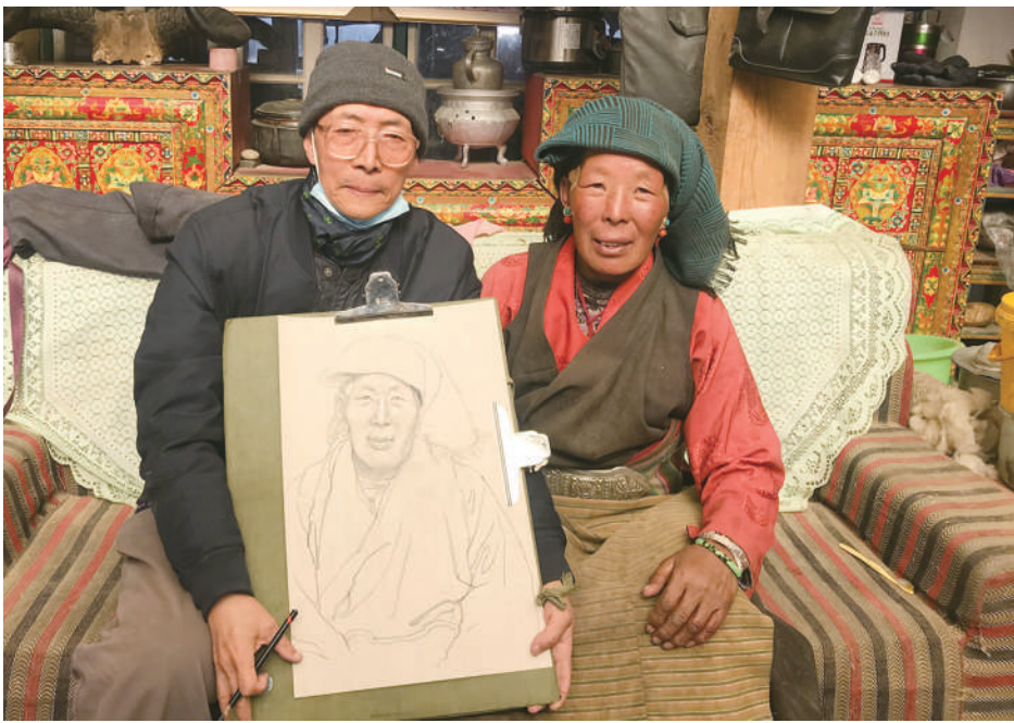
2020年韩书力(左一)在西藏自治区岗巴县贡巴村采风

日前,由北京市民族宗教事务委员会、中国藏学研究中心西藏文化博物馆主办,西藏自治区美术家协会协办的“韩书力西藏写生作品展”在京开展,呈现了第十、十一、十二届全国政协委员,西藏自治区文联原主席、西藏自治区美协原主席韩书力在西藏50载的创作探索,感受着他以画为媒,逐步了解认知西藏风情民俗、喜怒哀乐乃至精神境界的跋涉足迹。本报记者专访韩书力,请他讲述以绘画形式促进汉藏文化融合、铸牢中华民族共同体意识的探索、实践与思考。