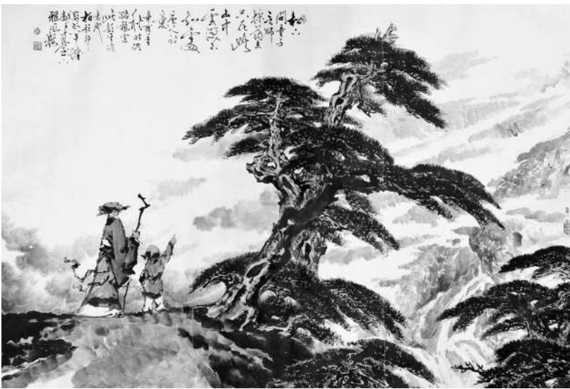
▲《王维诗意图》 单杓欬 作

众，有引人入胜之效。每一次播出，收视率都是排在上星电视同时段各档节目前列，反映了观众对古典诗词的持续性喜爱。新的一季，我们还将继续秉承守正创新的精神，不断完善，奉献出一台有创意有教益的诗词类文化节目。在内容上，不断在深度和视角上继续挖掘熟悉的“陌生题”，深挖诗词中的历史文化底蕴。在形式上，要走出录制舞台，走到诗词的现实生活中，在实景的历史文化现场体验诗词之美，让诗词走进生活，成为活态的文化，这样才能让中华优秀传统文化真正得以传承发展。如今AI虚拟呈现技术的运用，可以让古代诗人走进舞台，跨越千年与今天的观众对话。将诗词反映的历史文化场景再现舞台之上，让人有身临其境的体验。这加大了诗词与观众的互动性，成为节目的亮点，使诗词的内涵、意境活了起来，这也是一次将传统文化创造性转化的有益尝试。比如疫情期间，很多选手、观众不能到现场录制，这本来是无法克服的，但是有了远程视频同步参与、云端同步的呈现，便有了云中千人团的新形式。这样不仅可以突破空间的限制，容纳更多的观众参与进来。还可以实施远程实时互动。可以说，新的媒体技术使得节目更好看，更与时代发展同步，也让古典诗词更好地融入人们的生活，丰富人们的精神世界。