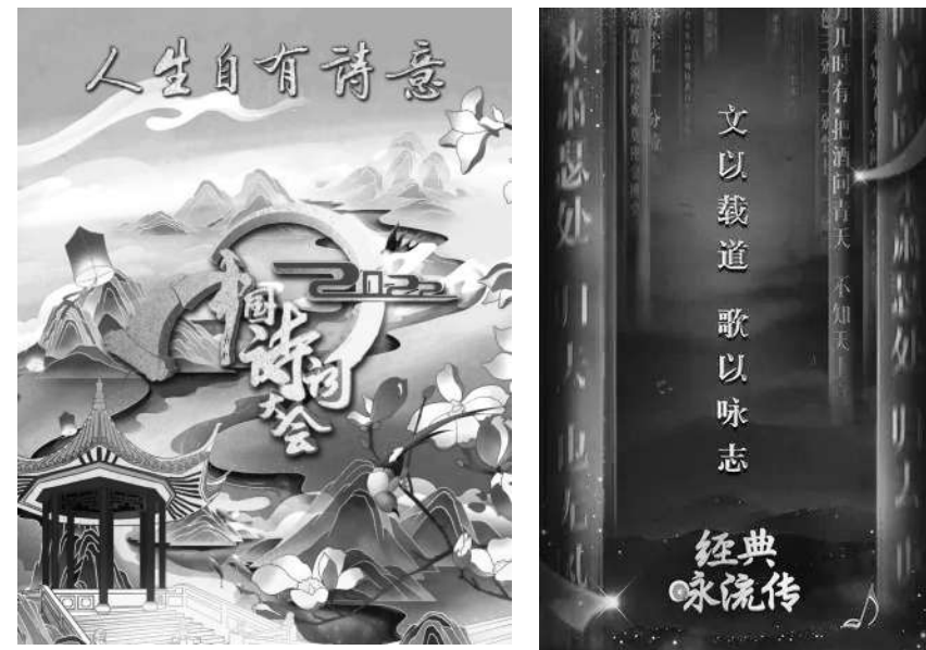
■ 中国传统文化艺术节