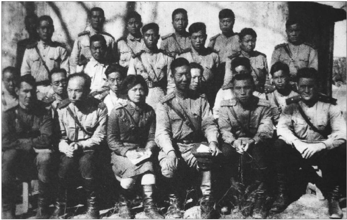
1943年10月5日,东北抗日联军教导旅野战演习后部分干部摄于北野营。

在九三抗战胜利日前夕,我们重温这首歌曲的创作过程,希望读者朋友们能从中体会到中华民族那种不畏强暴的浩然正气,前赴后继的牺牲精神,以及爱憎分明的革命情操。