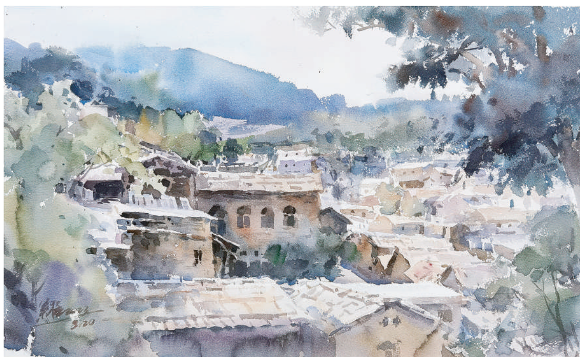
太行小戈廖村写生