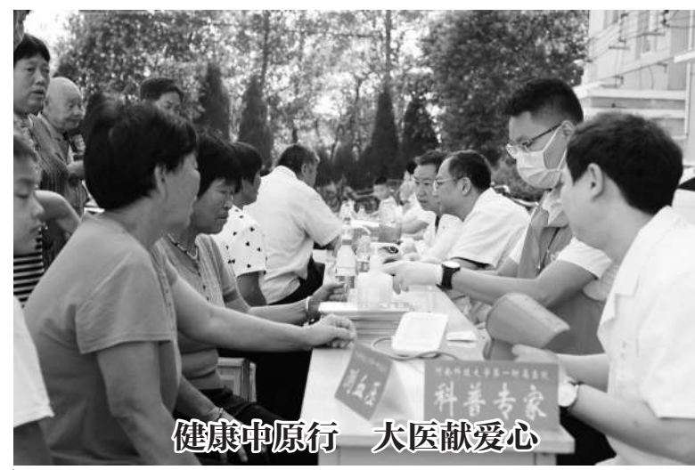
健康中原行 大医献爱心

健康促进是提升居民健康素养的重要方式。为提升居民健康素养，助力健康中国建设，8月30日，河南省洛阳市政协联合河南科技大学第一附属医院专家团队，赴新安县北冶镇刘黄村开展“健康中原行 大医献爱心”义诊活动，现场为健康体检、义诊把脉，针对多发疾病、常见病，提供用药指导、健康教育、饮食护理与治疗建议，受到村民们的一致好评。