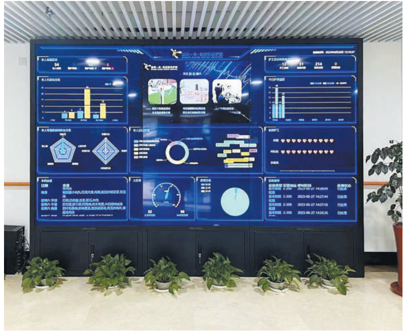
盈康一生徐泾镇养护院智慧大屏