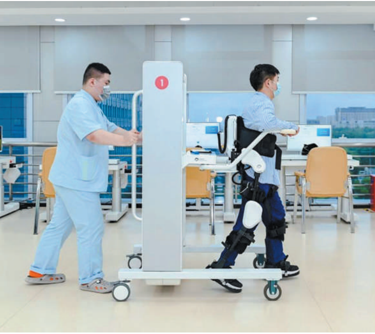
盈康一生上海永慈康复医院康复机器人物联港

盈康一生的发展路径同样遵循着全流程、全生命周期的原则,依托开放的生态平台,一方面打通了自身的医疗网络,将所有医院纳入到“医疗大平台”之上,打造出互联网医院生态;另一