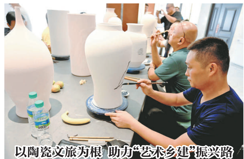
以陶瓷文旅为根 助力“艺术乡建”振兴路

坐落于江西省景德镇市近郊的三宝国际陶艺村,是景德镇市重点打造的陶瓷文化特色景区。随着陶瓷文创、研学体验、民宿餐饮、特色农产品等乡村绿色产业的兴起,村民在家门口就可以就业,闲置资产也有了价值,打通了生态文化和旅游经济发展的内在关联,实现了乡村振兴可持续发展。图为来自各地的艺术家在景德镇一家陶瓷厂体验陶瓷绘画艺术创作。