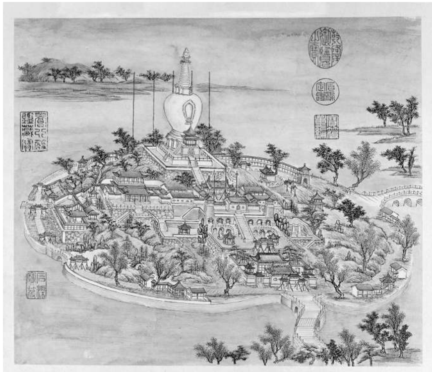
清代张若澄绘《燕山八景图》之《琼岛春阴》(北京故宫博物院藏)