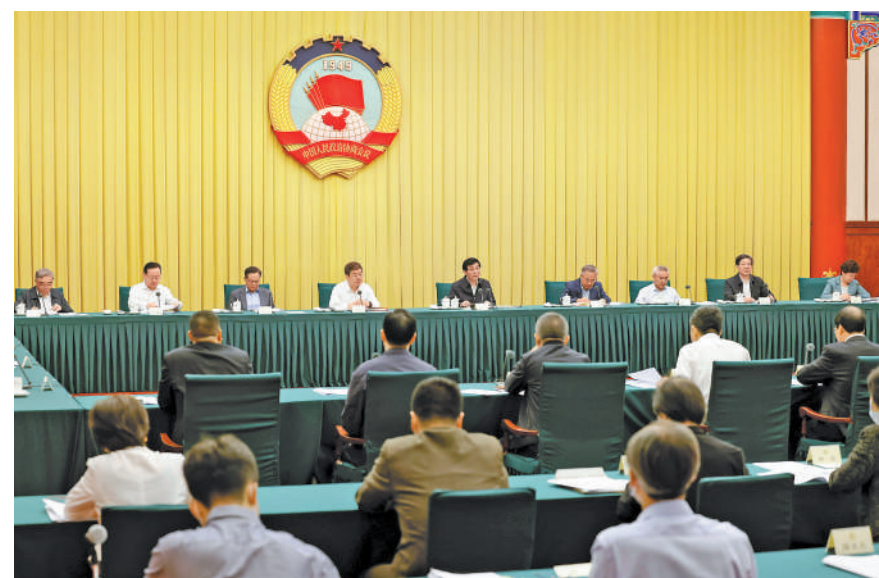
9月22日，十四届全国政协第十次双周协商座谈会在北京召开，中共中央政治局常委、全国政协主席王沪宁主持会议。

王沪宁表示，要深入学习贯彻习近平总书记关于教育的重要论述，围绕推动教育高质量发展、建设教育强国，做深做细议政建言、思想引领、凝聚人心工作。要聚焦中小学教研体系建设中的重点难点问题开展协商议政，助推中小学教研工作更好落实立德树人根本任务，助推中小学教研质量不断提升，助推建设高素质专业化的中小学教研队伍，助推完善中小学教研保障机制。要持续做好习近平总书记关于教育的重要论述的学习研究宣传，宣传好新时代教育事业的历史性成就，讲好人民