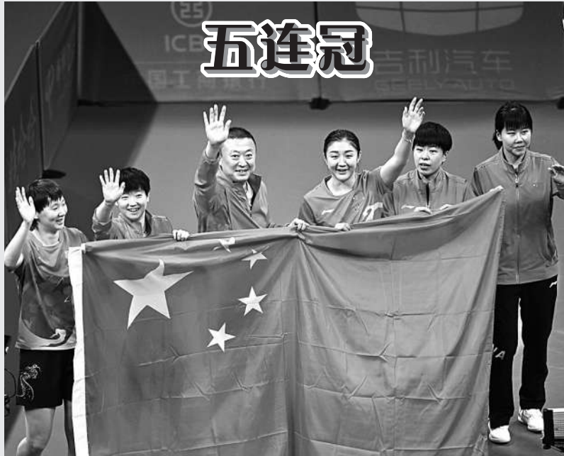
9月26日,在杭州亚运会乒乓球项目女子团体决赛中,中国队以3-0击败日本队,实现亚运会乒乓球女团五连冠。图为中国队夺冠后,教练与队员合影。