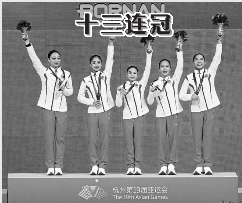
9月25日晚,在杭州亚运会竞技体操女子团体决赛中,中国队以161.896分的总成绩夺得冠军,中国体操女团实现亚运13连冠。图为中国队运动员在颁奖仪式上。