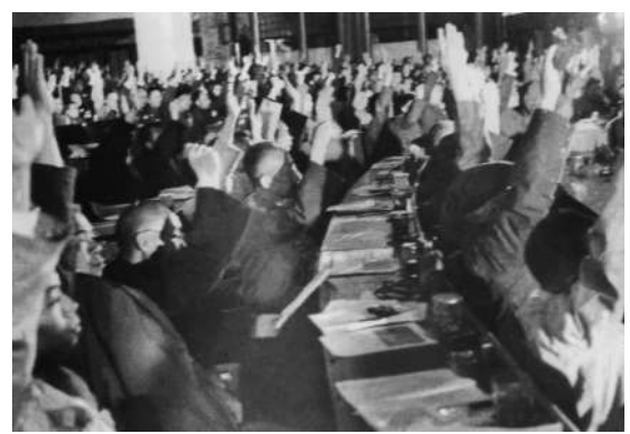
▼ 1949年9月27日,全国政协一届全体会议上,代表们以举手表决的方式通过国都国旗等决议案。

1954年9月20日第一届全国人民代表大会第一次会议通过的《中华人民共和国宪法》第四章第一百零六条专门是关于首都的规定:“中华人民共和国首都都是北京”。1949年讲“国都”,1954年称“首都”。