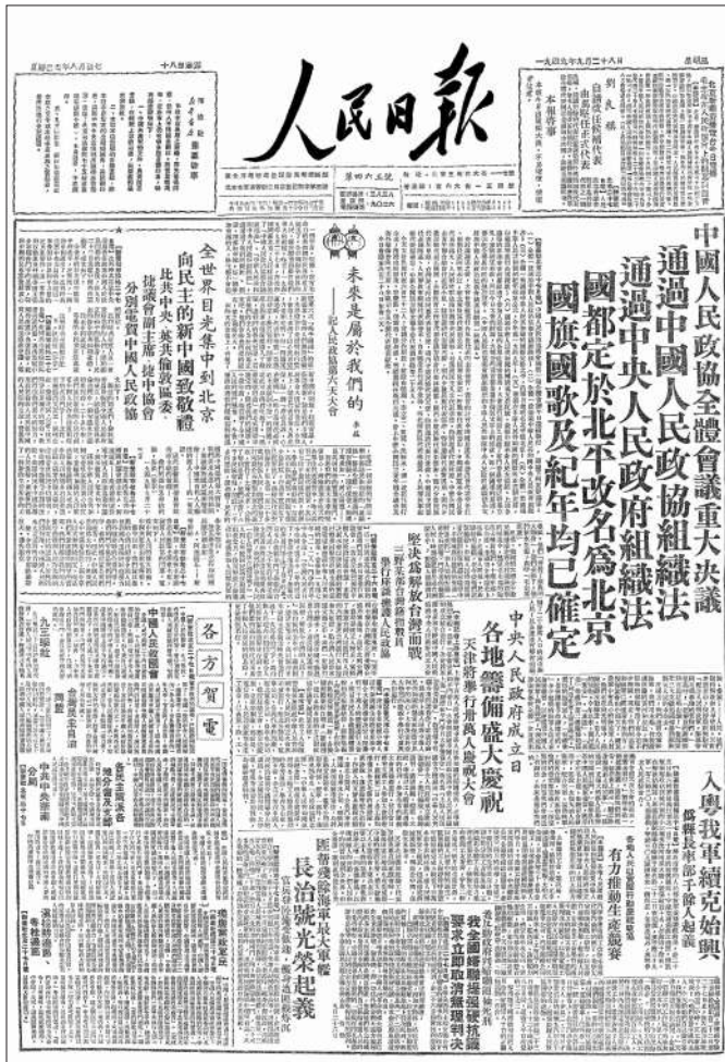
▶ 1949年9月28日《人民日报》第一版在显要位置报道了中国人民政治协商会议第一届全体会议做出的重要决定。