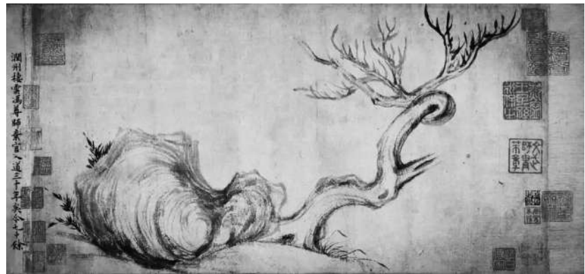
▲ 苏东坡绘画作品《枯木怪石图》

东坡一生都在学习，一生都在思考，所以他的创造也是贯穿终身的。东坡不仅仅在文学艺术方面成就卓著，他的学问、兴趣遍布其他学科，甚至连理工科也都关注。2011年5月，中国矿业大学苏轼研究院揭牌成立。中国矿业大学是研究矿业、煤炭等的高等学府，为何会成立苏轼研究院？原来，苏轼是中国采煤事业的先驱，徐州的