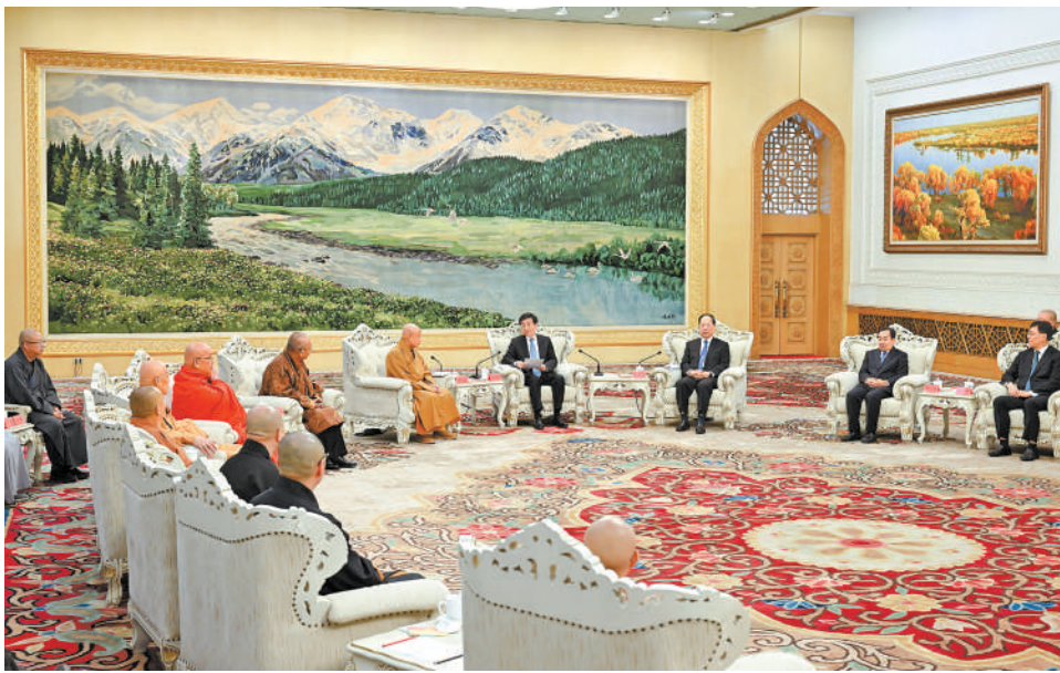
10月25日, 纪念中国佛教协会成立70周年座谈会在北京举行。中共中央政治局常委、全国政协主席王沪宁会见中国佛教协会领导班子成员, 并同全体代表合影。

新华社北京10月25日电 纪念中国佛教协会成立70周年座谈会25日在北京举行。中共中央政治局常委、全国政协主席王沪宁会见中国佛教协会领导班子成员, 并同全体代表合影。王沪宁对中国佛教协会成立70周年表示祝贺, 向全国佛教界人士和信教群众致以诚挚问候。