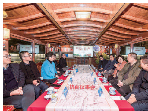
▲ 秦淮区省市三级委员开展阅读分享和协商议事。