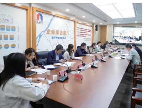
▲ 江宁区政府有关部门与经济界政协委员开展关于支持专精特新企业发展方面提案办理协商活动。

委员思想政治引领,政协党组“五步学习法”“情怀135”等书香品牌影响日益扩大,“书香政协风雅秦淮”获评江苏省政协最佳创新案例。秦淮区政协坚持“三个聚焦”精准建言,打造担当政协。聚焦党政大事要事,制定“四聚四提”行动计划,细化13项举措助力经济发展提速提质,就金融支持实体经济发展等议题,组织委员深入协商议政,以高质量建言成果助力经济高质量发展;围绕秦淮区与南部新城产城融合、夫子庙商圈转型发展等进行广泛协商,助力经济加快复苏。聚焦群众关心热点,开展民生专题协商议事月活动,选择小区微更新、融合教育等小切口、针对性强的议题进行协商建言。聚焦社会治理难点,每年召开议政性协商会议、常委会会议、协商座谈会等20余场,组织协商议事活动上百场,一批意见建议得到党委政府重视和采纳。