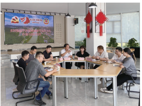
▲ 雨花台区政协在铁心桥街道围绕社区治理召开议事会。