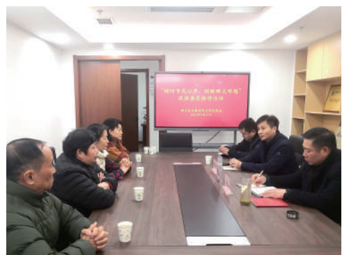
▲ 建邺区政协开展委员接待活动。