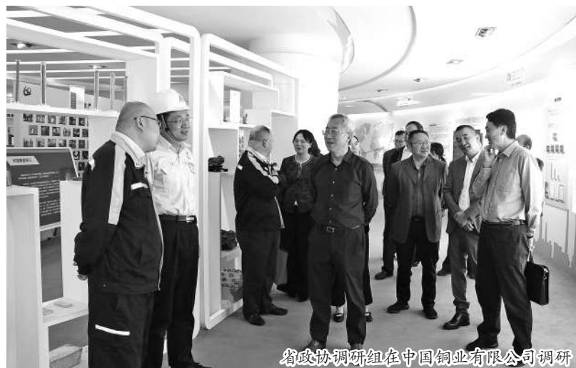
省政协调研组在中国铜业有限公司调研

将推进产业链延链补链，加快建设一批省级创新平台，依托龙头企业组建创新联合体，推动关键核心技术攻关，推动科技成果转化。持续开展产业转移和招商引资，深化巩固产业转移发展对接活动成果，推动产业转移洽谈项目签约落地见效。加大产业链协同服务力度，充分运用工作专班推进机制，加强统筹协调，突出要素保障，加快重点项目建设。