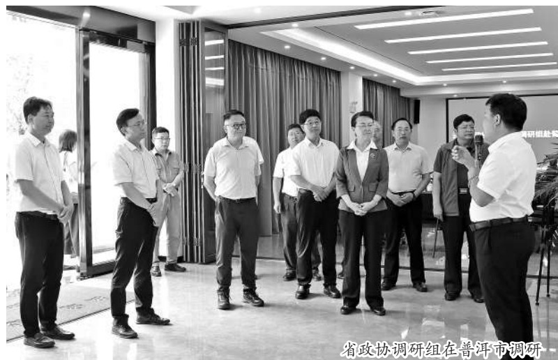
省政协调研组在普洱市调研

“随着在我省保有储量居全国前10位的铅、锌、锡、铜等金属的开发利用，这些金属中伴生的10余种小金属应有更多的应用场景和发展空间。”杨桂红常委呼吁，组建小金属利用战略联盟，加大小金属下游产业方面的招