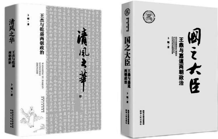
卜键教授部分著作