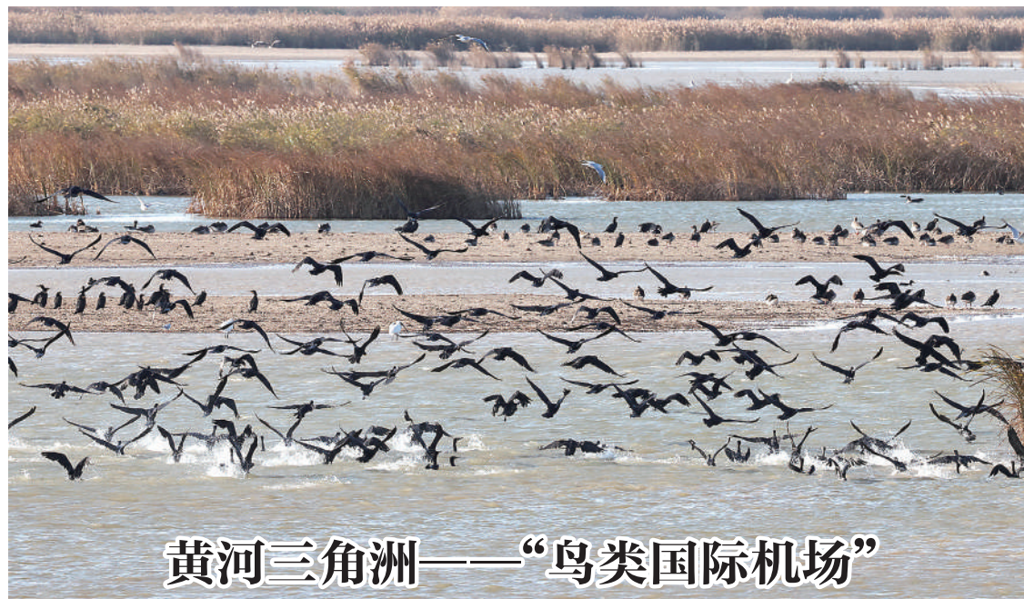
黄河三角洲——“鸟类国际机场”

“大湘西地区仍面临供气保障差、购气价格高的问题，群众反映没有享受到气化湖南工程的红利。”涉及大湘西地区800多万群众用气保障的重点提案《加强大湘西地区用气保障、提升地区发展竞争力的建议》，提出解决大湘西管网保供气源、积极推进全省天然气同网同价等建议。6月28日，重点提案办理协商会在张家界召开。(下转2版)