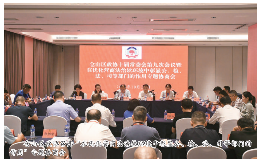
仓山区政协召开“在优化营商环境中彰显公、检、法、司等部门的作用”专题协商会

“人民群众担心、操心、揪心、烦心的事，就是我们关心的事。”今年，仓山区政协还先后开展了“关于提升仓山区合理布局，推动教育公平发展和质量提升”专项民主监督、“推动学校实施多样化特色化教学，促进‘双减’政策背景下学生全面发展”对口（界别）协商，以及“关于医养结合提高养老健康质量的建议”“关于提高仓山区社区卫生服务中心医疗能力的建议”“关于小区物业公共收益合理分配和资金监管的建议”等重点提案办理协商活动，进一步将情牵“万家灯火”，心系“急难愁盼”融入年度履职计划之中，让协商真正成为解民