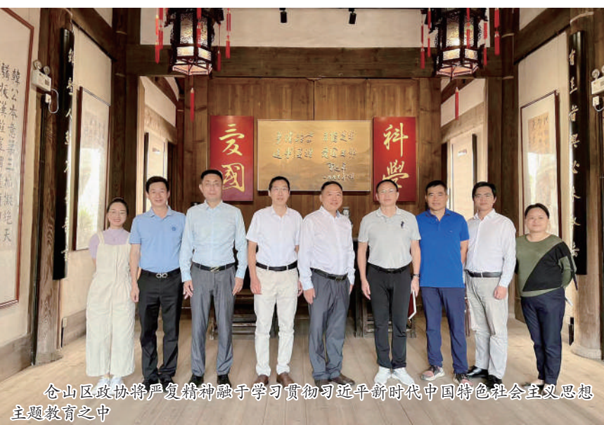
仓山区政协将严复精神融入学习贯彻习近平新时代中国特色社会主义思想主题教育之中

“严谨治学，首倡变革。追求真理，爱国兴邦。”1997年，习近平同志为严复思想题写下这十六个大字，始终激励着仓山区政协奋发作为。潘仰武表示，未来，仓山区政协将在习近平新时代中国特色社会主义思想的指导下，站在新的历史起点上，缅怀先贤功绩，传承先进思想，不忘“来时路”、走好“脚下路”、坚定“未来路”，为全区实现“3820”的宏伟蓝图，打造现代化国际城市先行示范区作出新的更大贡献！