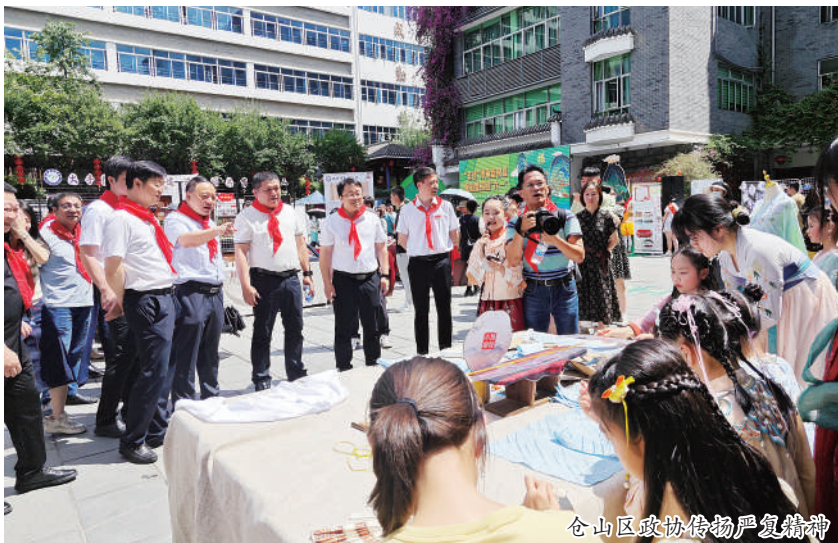
仓山区政协将严复精神融入学习贯彻习近平新时代中国特色社会主义思想主题教育之中

福建省委书记、省长的习近平同志主编了《科学与爱国——严复思想新探》一书，并作序，深情称赞严复“高举科学与爱国两面大旗”的话语，言犹在耳。 哲人虽逝，精神永存。福建省福州市仓山区盖山镇阳岐村是严复的儿时故里，长眠之地。为纪念故人、传承精神，仓山区政协将严复精神融入学习贯彻习近平新时代中国特色社会主义思想主题教育之中，感悟思想之伟，激发奋进之志，弘扬实干之风，切实敢为、善为、有为，不断增强锐气、朝气、志气，全面推动仓山政协事业在新征程上再立新功、再创佳绩。