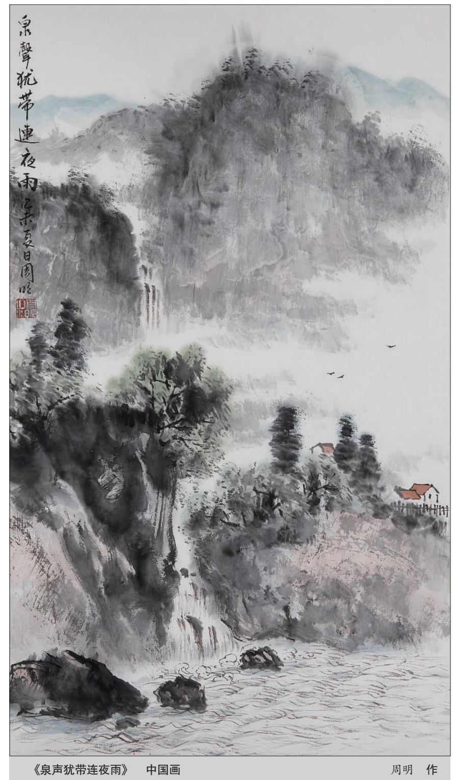
《泉声犹带连夜雨》 中国画