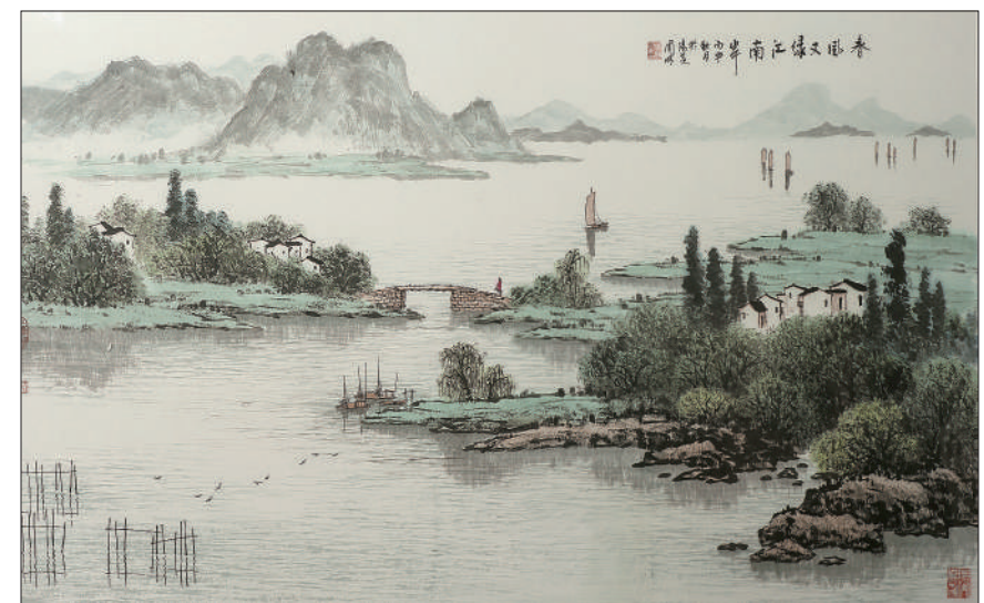
《春风又绿江南岸》 中国画