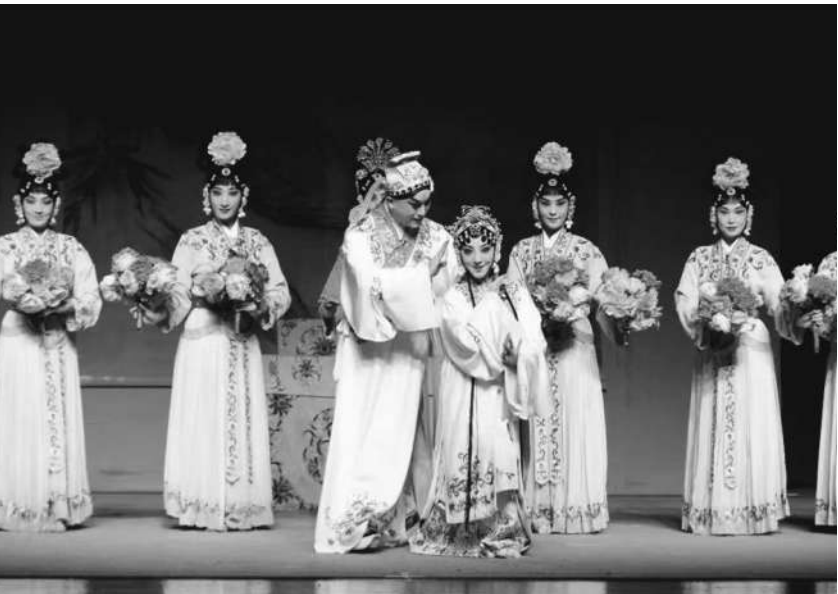
戏曲是中华优秀传统文化的精粹之一。图为北方昆曲剧院《牡丹亭》剧照