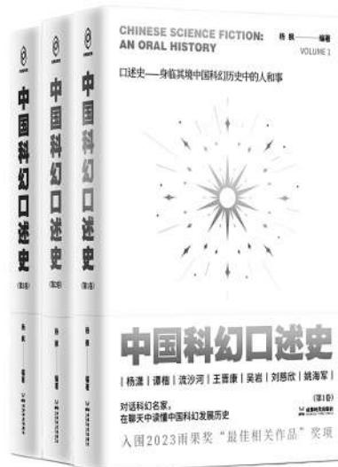
▲《中国科幻口述史》（全3卷）

变的新成果。在新时代，大部分时候文学都充盈着哲思，科幻文学也不例外。我们希望在未来文学中以美学之光呈现出新时代中国人的哲思之灵。