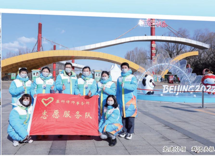
盈科北京团总支主题党日