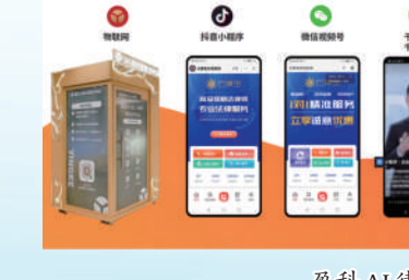
盈科AI律所智能空间站

专业的一对一的视频法律及其他法律咨询类的创新服务模式。尤其针对律师资源较为匮乏及法律服务需求集中的地区，10秒内作出响应，链接专业对口律师帮助群众答疑解惑。 2023年9月2日至6日，2023中国国际服务贸易交易会在国家会议中心和首钢园区举行。9月5日，盈科律师事务所的4项成果——大型直播间全流程合规、数据安全与个人信息保护合规、碳交易风险防控法律服务产品和数字人探秘盈科AI律所正式亮相中国国际服务贸易交易会成果发布会。未来，盈科将积极拥抱AI新变化，在2025年全面建成“数智盈科律所”，为客户带来更好的服务体验。