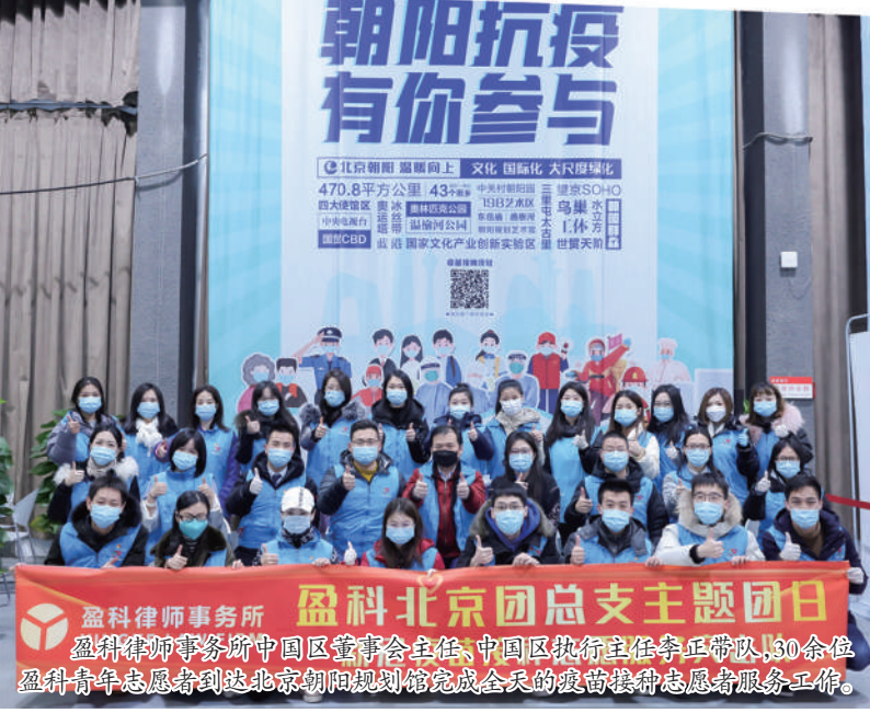
盈科北京团总支主题党日