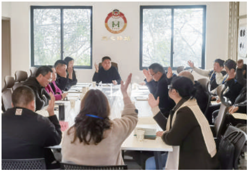
九龙镇清泉村同心驿站协商议事会现场