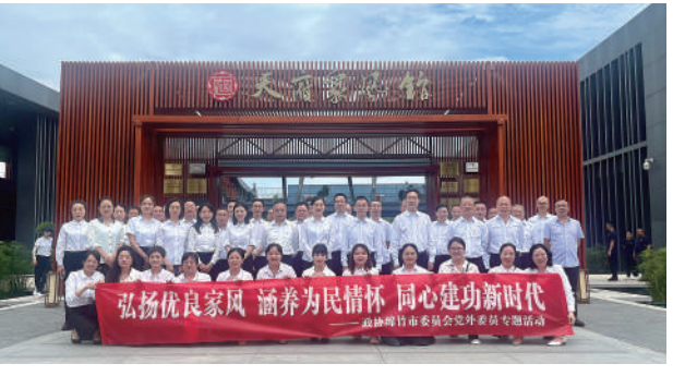
绵竹市政协组织党外委员开展“弘扬优良家风 涵养为民情怀 同心建功新时代”专题活动