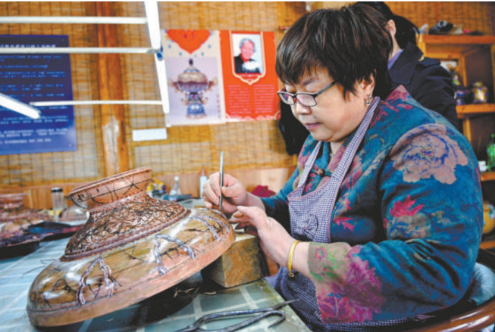
河北香河县蒋辛屯镇北李庄村村民在制作景泰蓝工艺品