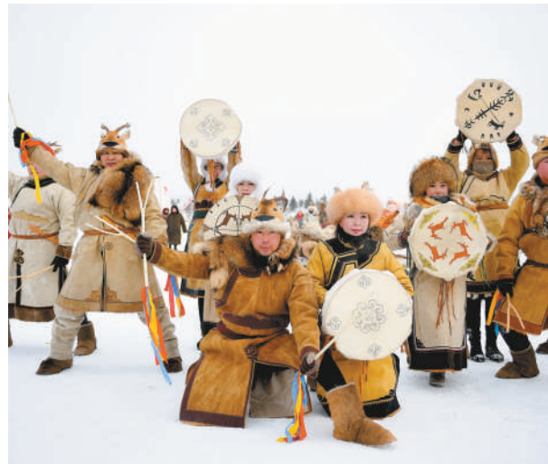
鄂伦春自治旗莫日根民间艺术团表演精彩的民族舞蹈