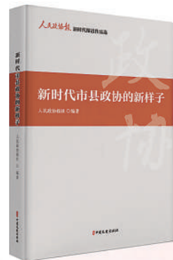
《新时代市县政协的新样子》 单本定价：75.00元