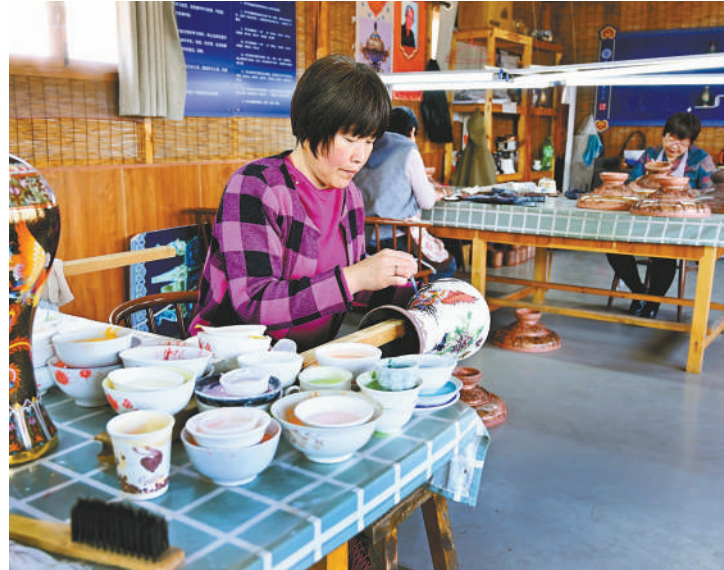
河北香河县蒋辛屯镇北李庄村村民制作的景泰蓝工艺品，为村民增加了收入。

今年，人民政协迎来创刊40周年的日子。为此，人民政协报社联合中国文史出版社、中华书局出版了8本精品图书。文章精选自报纸的专栏、专题报道。希望这些图书对各地政协做好新闻宣传工作、讲好履职故事有所帮助，同时，为助力书香政协建设，推动全民阅读作出贡献。