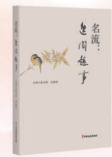
《名流：逸闻趣事》 定价：86.00元

联系地址：北京市海淀区西八里庄路69号人民政协报大厦二层 征订电话：(010) 88146977 (010) 88146970 (010) 88146941