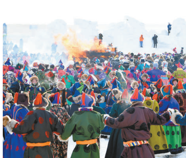
冬季那达慕祭火仪式隆重而热烈