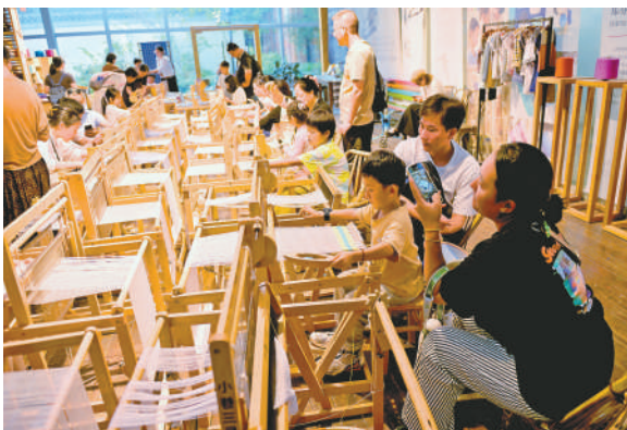
孩子们体验传统纺织技艺