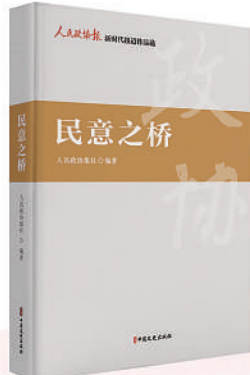
《民意之桥》 单本定价：75.00元