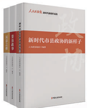
人民政协报新时代报道作品选 (全三册) 定价：238.00元/套