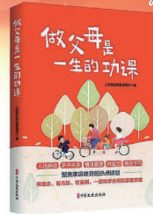
《做父母是一生的功课》 定价：59.80元