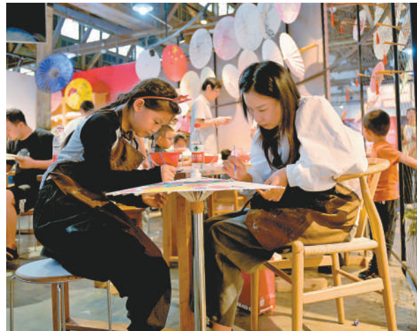
在妈妈的带领下，体验油纸伞的绘画和制作。