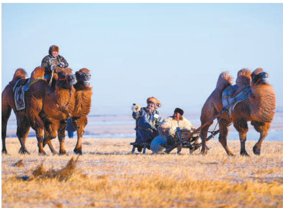
冬季草原上的骑骆驼和乘坐骆驼爬犁是游客最好的体验