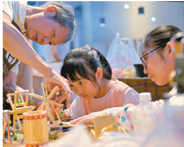
木工制作吸引着孩子们