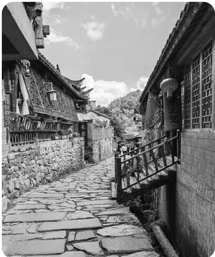
如今的茶马古道驿站焕发新的生机和活力。