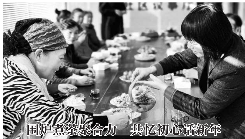
围炉煮茶聚合力 共忆初心话新年

日前，在北京市石景山区苹果园街道军一社区老街坊议事厅，各支部书记和社区工作人员齐聚一堂，开展围炉煮茶话新年活动。该活动旨在将中国茶文化融入社交活动，提供全新的温暖社交方式，进一步凝聚社区合力。