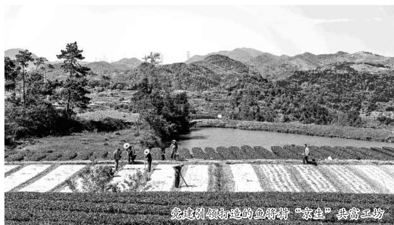
党建引领打造的鱼鳞塘“农家”共富工坊

展实地调研,凝聚政府、企业和社会多方合力,详细了解石磁生态搬迁以及闲置资源利用情况。镇镇政协委员以“民生议事堂”为重要抓手,组织专项活动,为打造“一米菜园”等事项积极建言献策,让各搬迁安置户离开故土也能拥有自己的“一