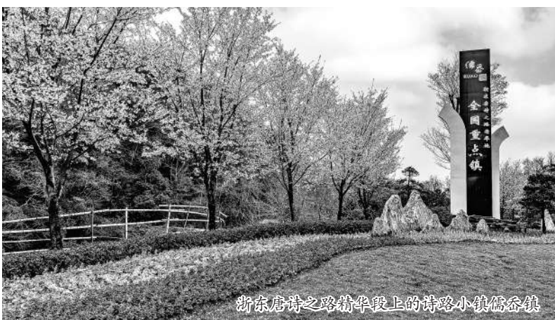
浙东唐诗之路新昌段上的唐诗小镇儒岙镇

方天地”。镇镇政协委员与镇镇村建办、两美办开展调研,详细了解生态搬迁具体情况,委员们从提升村容村貌、发展特色产业、壮大农旅事业等方面积极建言献策,以期搬迁农户能通过土地流转、山林权流转、产权租赁等举措进行盘活,利用山上闲