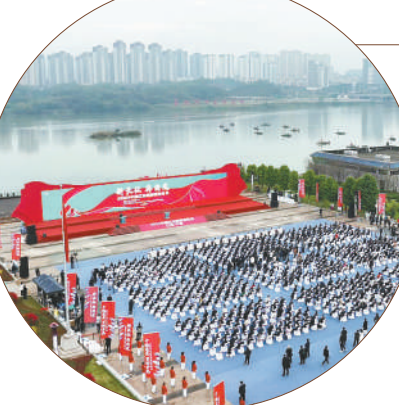
“新长征,再出发。”12月8日至10日,2023中国红色旅游博览会在江西省于都县举行。“大国重器”主题展馆、江西馆、湖南馆、红色旅游线路馆、数字科技馆、红色旅游演艺馆以及两个红色旅游文创馆,生动诠释了“红色+”旅游新

少重点区域民宿产业集聚区建设的详细规划,缺乏民宿与文旅产业、国土空间布局衔接性规划。”陈明德为此建议规划先行,进一步研究制定民宿高质量发展规划,出台相应的民宿发展规划路线图。因地制宜,客观评估,科学配置,统筹规划好民宿发展集聚区;重点做好“百家”民宿,“千家”民宿集聚区详细规划,科学配置公共设施与服务资源,逐步形成梯次配置合理、规模集聚适度、特色主题鲜明的