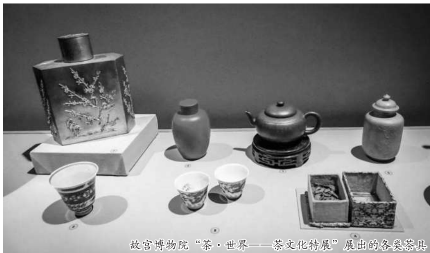
故宫博物院“茶·世界——茶文化特展”展出的各类茶具

关于茶文化的内容还有很多，中国文物文献中记录的茶历史、茶文化也不计其数。就以《茶经》来说，南宋百川学海本《茶经》，是集典籍与文物于一身的典范。作为典籍，《茶经》对茶叶和茶文化具有开创之功，它是中国第一部茶学百科全书，一直以来被奉为茶文化的经典，对中国以及世界茶文化的发展产生了重大而深远的影响。