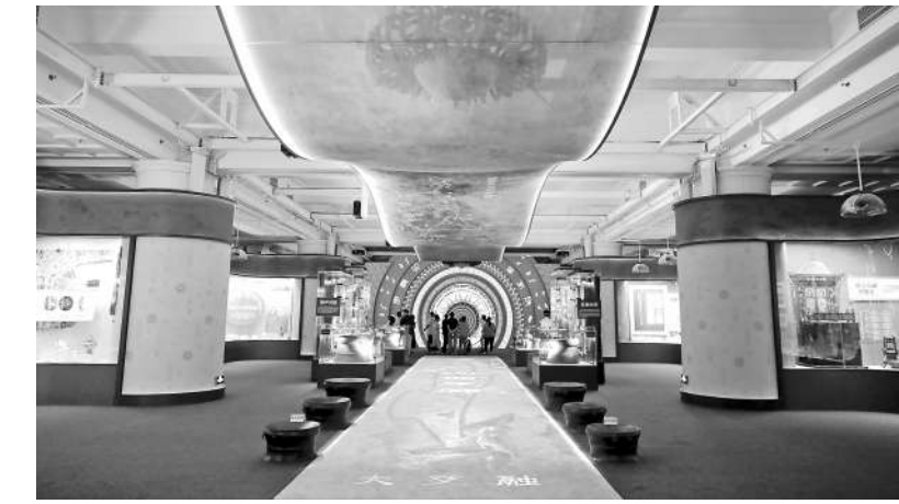
▲ 铸牢中华民族共同体意识文物古籍展

的根本保证。鸦片战争以后,中华民族面临着“亡国灭种”的危机,先进的中国人阐述中华民族复兴思想,唤起民族觉醒。抗日战争时期,各民族同仇敌忾、并肩战斗,取得伟大胜利。新中国成立后,实行民族平等、民族团结、民族区域自治和各民族共同繁荣发展的政策,各民族实现了千百年来当家作主的夙愿。改革开放以来,各族人民坚持发展是硬道理,积极投身社会主义现代化建设事业,用双手书写了国家和民族发展的壮丽史诗。进入新时代,各族人民像石榴籽一样紧紧抱在一起,不断